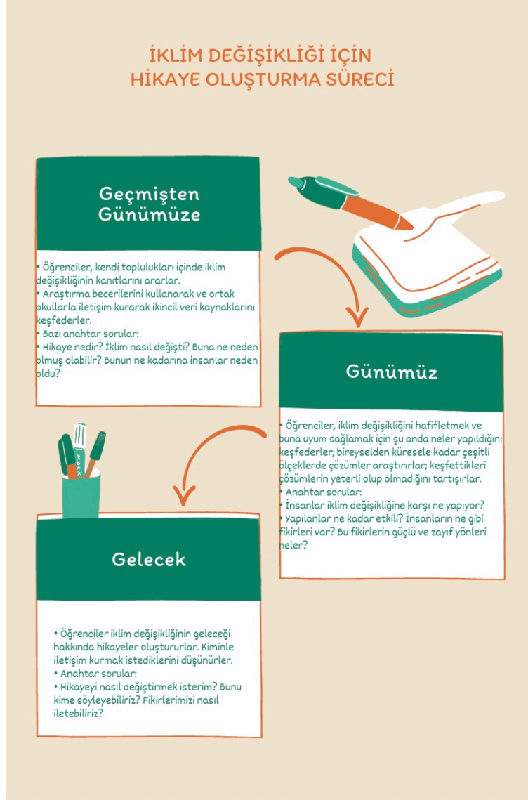
Şekil-1. Change the Story Projesi için Öğrenme Akışı

Öğrencilerin iklim değişikliği ile ilgili araştırmalarını yaparken yardımcı olabilecek diğer sorular ise şöyledir: